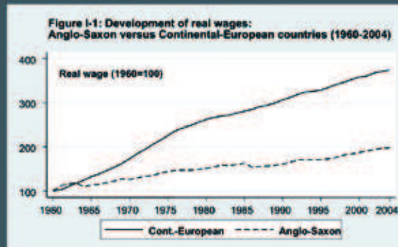
De loonontwikkeling in Angelsaksische landen versus die in Europa.

Een van de resultaten van Kleinknechts onderzoek is dat lagere loongroei en soepel ontslag niet leiden tot meer welvaart; een van zijn argumenten om meer te zien in het Rijnlandse economische model.