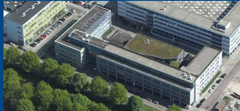
Jaffalaan 5 / Postbus 5015 2628 BX Delft / 2600 GA Delft

TBM in Beeld Faculteit Techniek, Bestuur en Management (TBM)